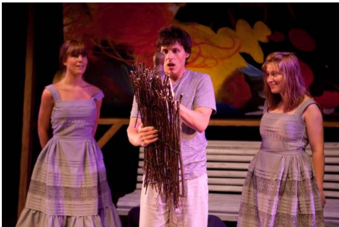
Fotografia de ensaio © Filipe Ferreira

O Auto do Velho da Horta divide-se em duas partes, mas antes há um prólogo que antecede a entrada da Moça. E com a entrada desta inicia-se a primeira parte que vai terminar com o primeiro canto do Velho (versos 370 a 374), dando lugar a um curto intervalo, após o qual se dá início à segunda parte : estando o Velho presente, como no início do Auto, em apreciação daquelas obras de Arte oferecidas por si ao Museu do Vaticano, entra a Alcoviteira para observar e desenhar as estátuas, são as suas rezas e adorações. Esta segunda parte vai terminar com a prisão da Alcoviteira pelo Alcaide e a lamentação do Velho (até ao verso 712). Por fim, tem lugar como que um reinício da peça, o que constitui o êxodo , uma curta acção que, ainda do mesmo modo que as outras partes, começa com a entrada da Mocinha no Jardim estando o Velho na sua apreciação habitual das estátuas, mais uma vez, sublinhamos, repetindo o início da acção da peça.