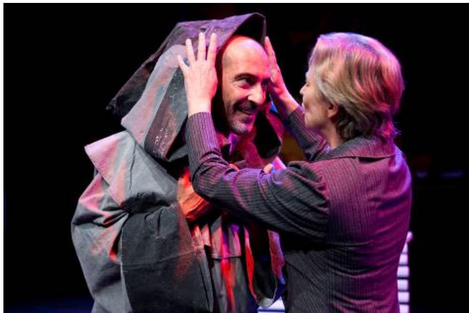
Fotografias de ensaio © Filipe Ferreira