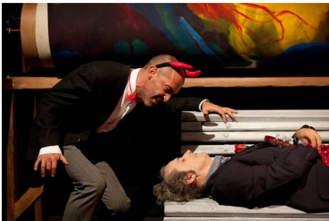
Fotografia de ensaio © Filipe Ferreira

No início o prólogo é composto por seis quintilhas em redondilha maior com uma rima abaab . De resto, com a exceção de dois casos, todo o restante texto da peça é composto por enlaces (coplas) de duas estrofes, uma quadra com a rima abba e uma sextilha com o primeiro e o sexto verso quebrados e com a rima aabaab .