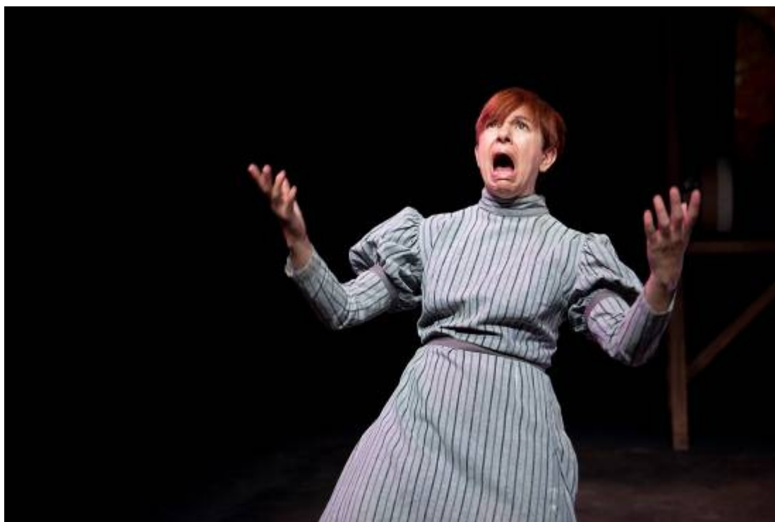
Fotografia de ensaio

Em o Auto da Alma , estamos novamente perante uma viagem repleta de obstáculos e enganos: a contaminação, pelo Mal e pelo Bem está outra vez presente, assim como a oposição entre o terreno e o celestial. Gil Vicente aborda aqui o eterno paradigma do destino do homem e da sua errância. A Alma, frágil e permeável a influências que lhe chegam ora do Anjo, ora do Diabo, vai errando entre o desejo de vícios e a urgência de virtudes. Este movimento pendular e oscilatório é de uma extrema atualidade, pela forma como Gil Vicente aborda temas intemporais debatidos ainda hoje na sociedade contemporânea. Gil Vicente estaria certamente a par das reflexões moralistas de Erasmo ou Vives