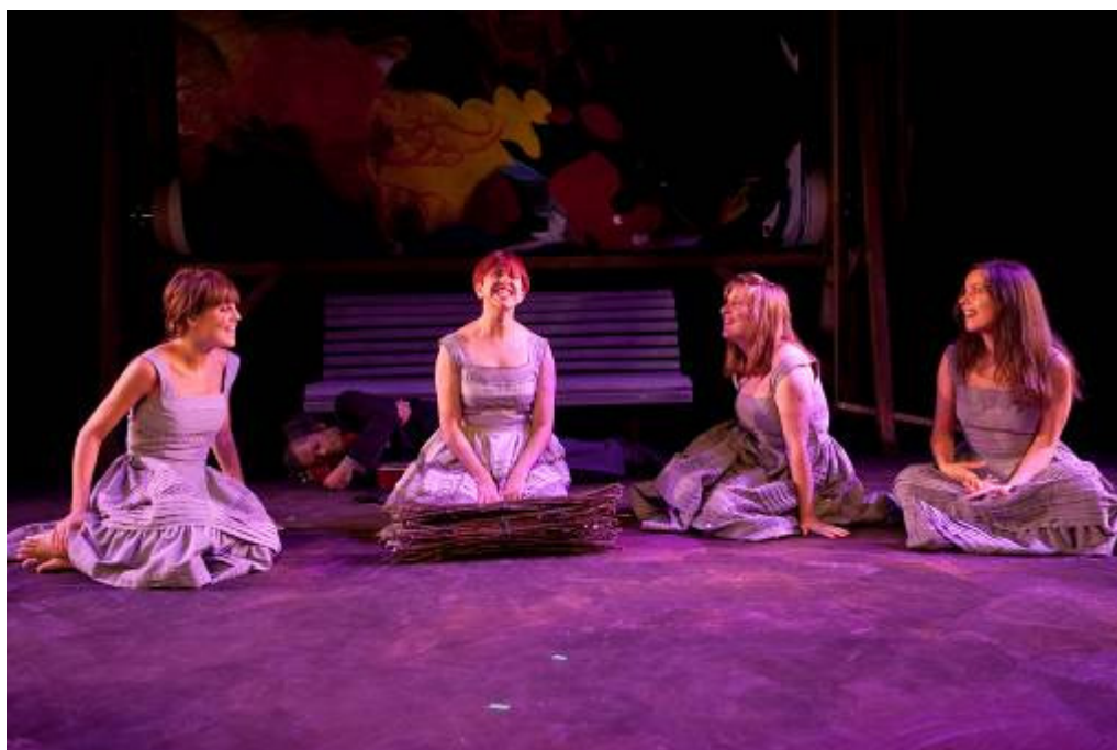
Fotografias de ensaio © Filipe Ferreira