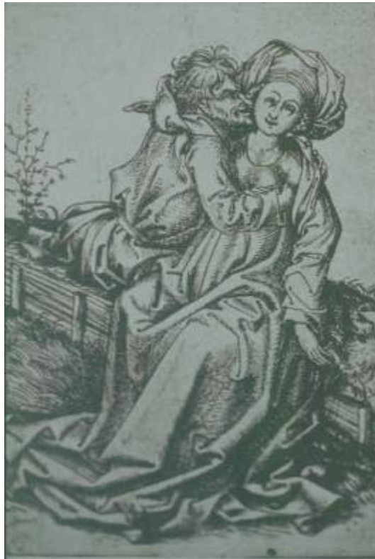
Velho louco beijando rapariguinha, Lucas van Leyden, Gravura, 1520.

"Os amores desiguais tratam dos amores entre velhos e jovens ( Triunfo do Inverno [1529], Velho da Horta [1512]).