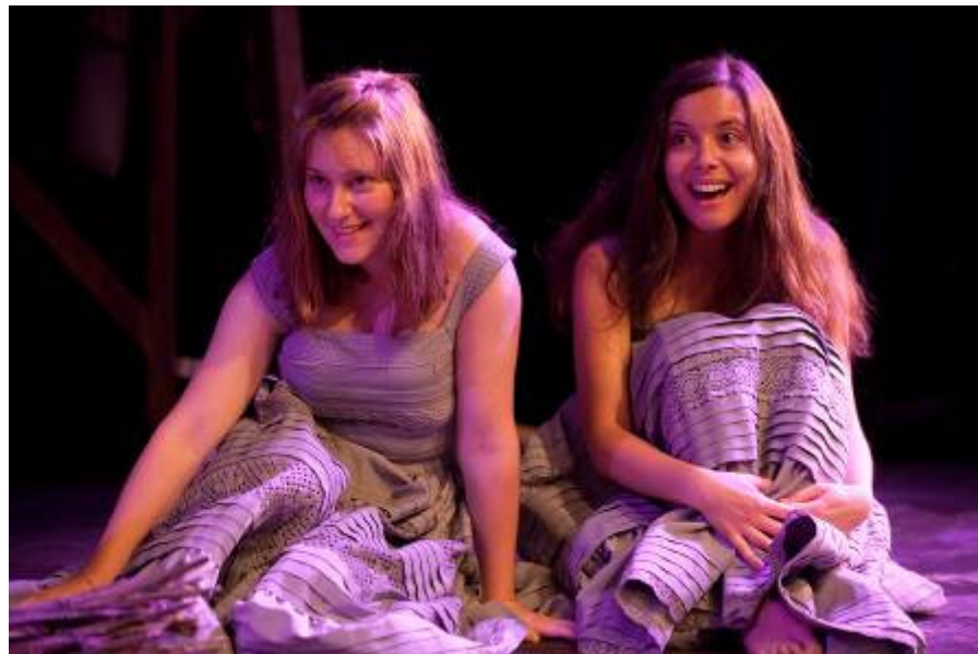
Fotografia de ensaio © Filipe Ferreira