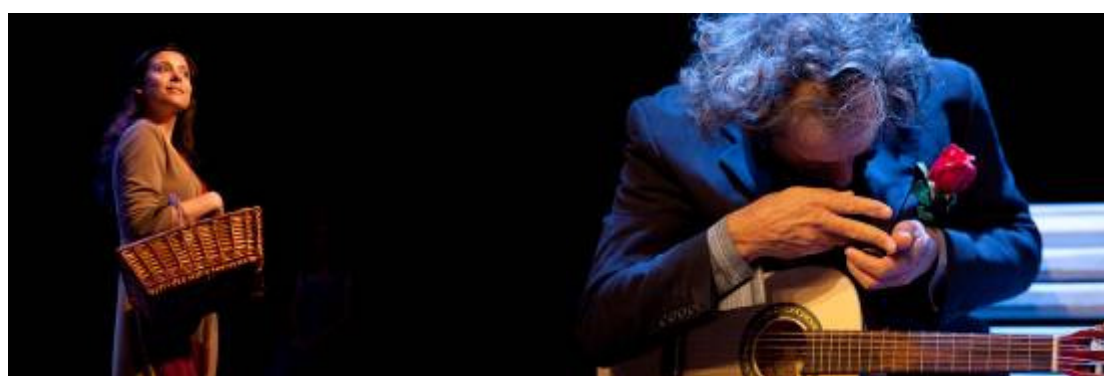
Fotografias de ensaio