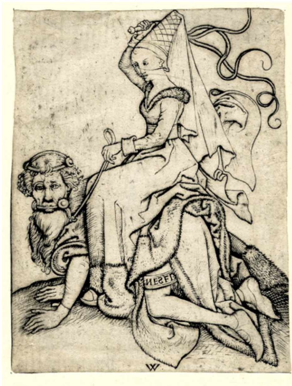
Aristóteles e Filis (gravura).

O Velho da Horta não é isento de uma intenção moralizadora, enfatizada pelo casamento feliz da jovem e pela tomada de consciência final do protagonista - que prefigura a reposição da ordem temporariamente perturbada por um amor fantasioso -, não é decerto por acaso que, na sua última intervenção, o Velho reencontra nesse mesmo eixo semântico a expressão adequada à sua recuperada lucidez, quando retrospectivamente analisa o comportamento louco em que incorrera.