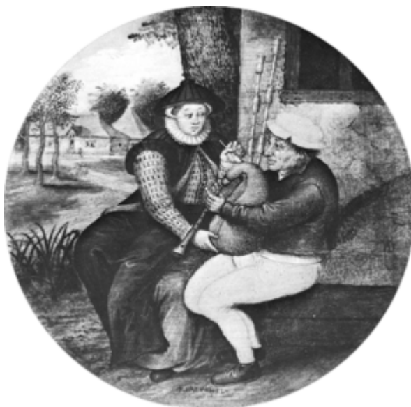
Pieter Brueghel o Jovem, Velho Gaiteiro .

"O levantamento das figuras femininas nas peças de Gil Vicente já foi feito. Excluindo a figura da Virgem (mas devemos ter sempre presente a forte componente mariânica da espiritualidade vicentina) e das Fadas (atentemos que não há santas, nem santos), as figuras femininas quase poderiam ser agrupadas em dois conjuntos: de um lado aquelas que detinham uma clara referência à vida real, como moças, mães, alcoviteiras, ciganas e que coincidem no facto de serem, em regra, figuras de fora da corte, do lá de fora e não do cá de dentro; do outro lado as figuras femininas recrutadas no mundo da fantasia ou do fingimento romanesco, cavaleiresco, fabuloso ou alegórico, perspectivadas dentro do jogo dos convencionalismos de corte e, portanto, mais do cá de dentro do que do lá de fora. Esta distinção tem um significado bastante maior do que pode parecer à primeira vista.