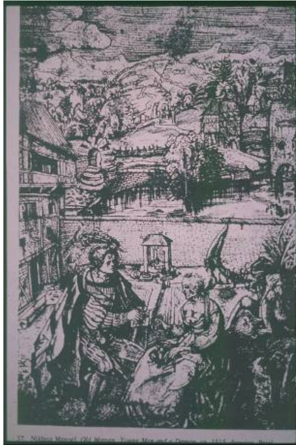
Velha, Jovem e Demónio, Niklaus Manuel, Basileia, 1515 (gravura)