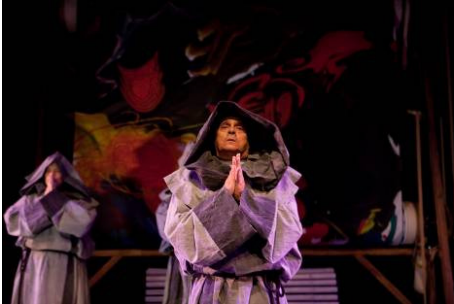
Fotografia de ensaio