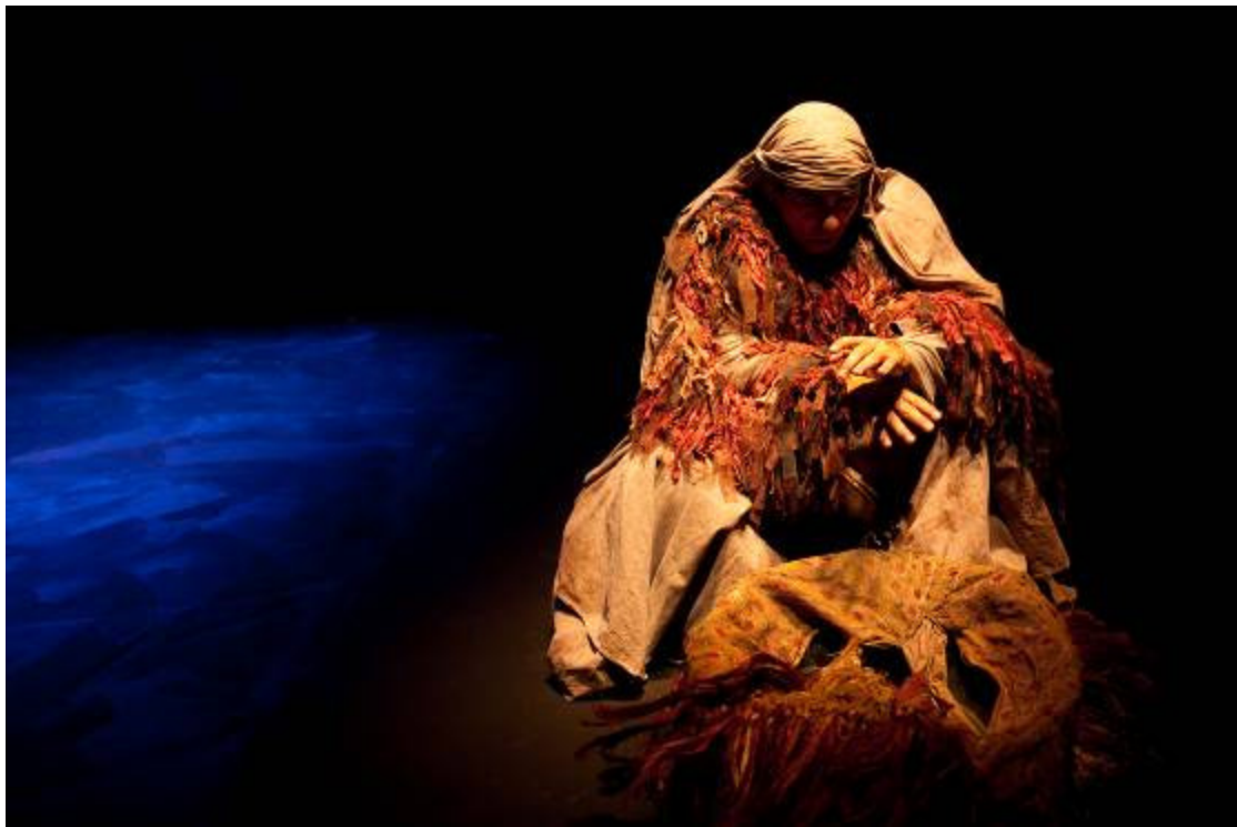
Fotografia de ensaio

Estreada em 1512, o Velho da Horta é uma peça escrita em português há 500 anos. Penso que deveria ser obrigatório para um Teatro Nacional ter sempre uma peça de Gil Vicente em cena. A sua linguagem, um pouco complexa num primeiro impacto, acaba por ser complementada pela sua musicalidade e pela ação do próprio texto. Gil Vicente é, acima de tudo, um poeta. E o mundo precisa cada vez mais de poesia.